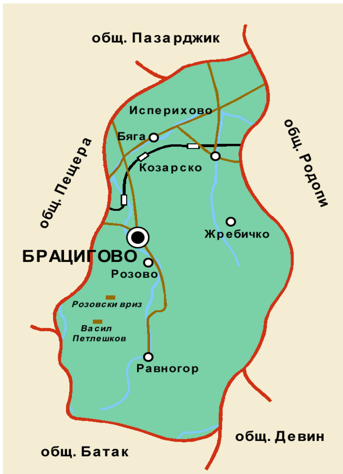
Приложение VII.4. Карта на община Брацигово